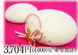
3,704円(4,000円) ※写真はイメージです。