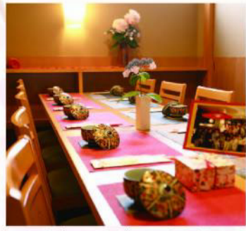
個室(テーブル) 30名様まで